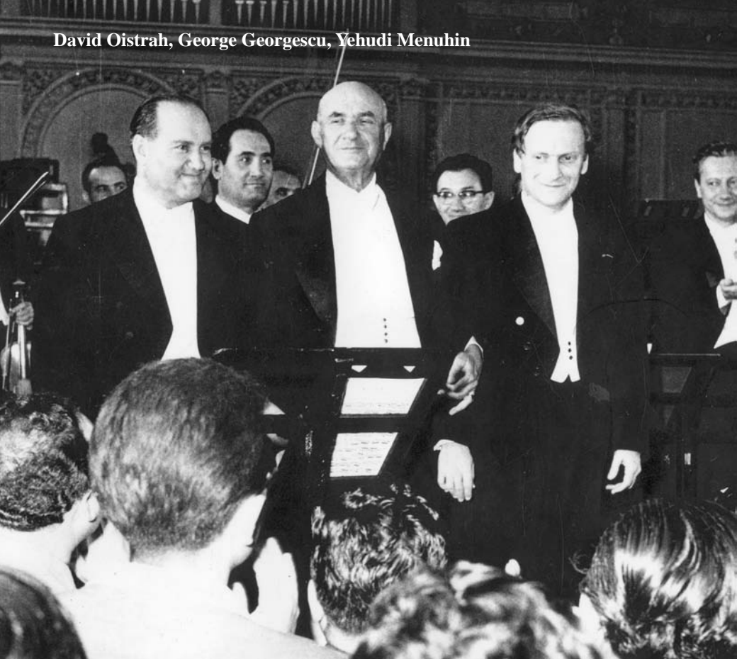
David Oistrach, George Georgescu, Yehudi Menuhin